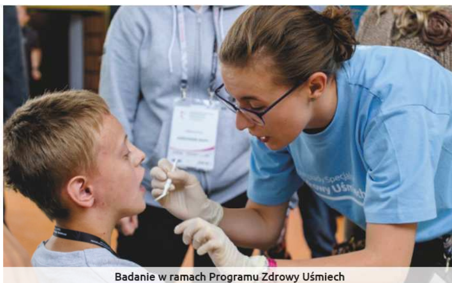
Badanie w ramach Programu Zdrowy Uśmiech