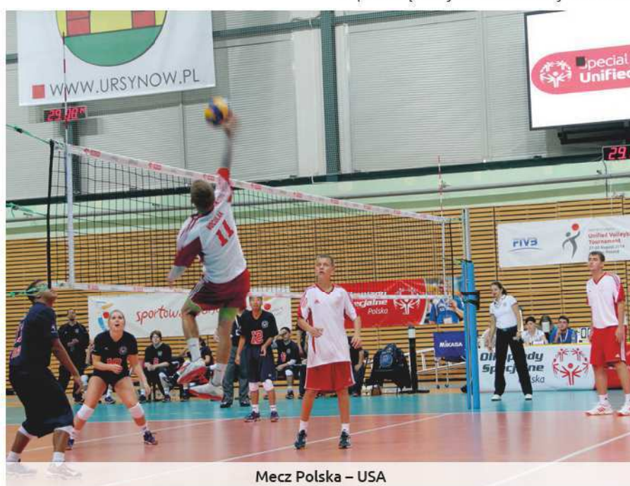
Mecz Polska – USA

– Siatkówka to chyba najtrudniejszy sport zespołowy, sprawia trudność nawet ludziom bez niepełnosprawności intelektualnej, dlatego jestem pod wrażeniem gry i zaangażowania zawodników Olimpiad Specjalnych, którzy dobrze radzą sobie w tej dyscyplinie. Widzę w nich ogromny zapał do gry,