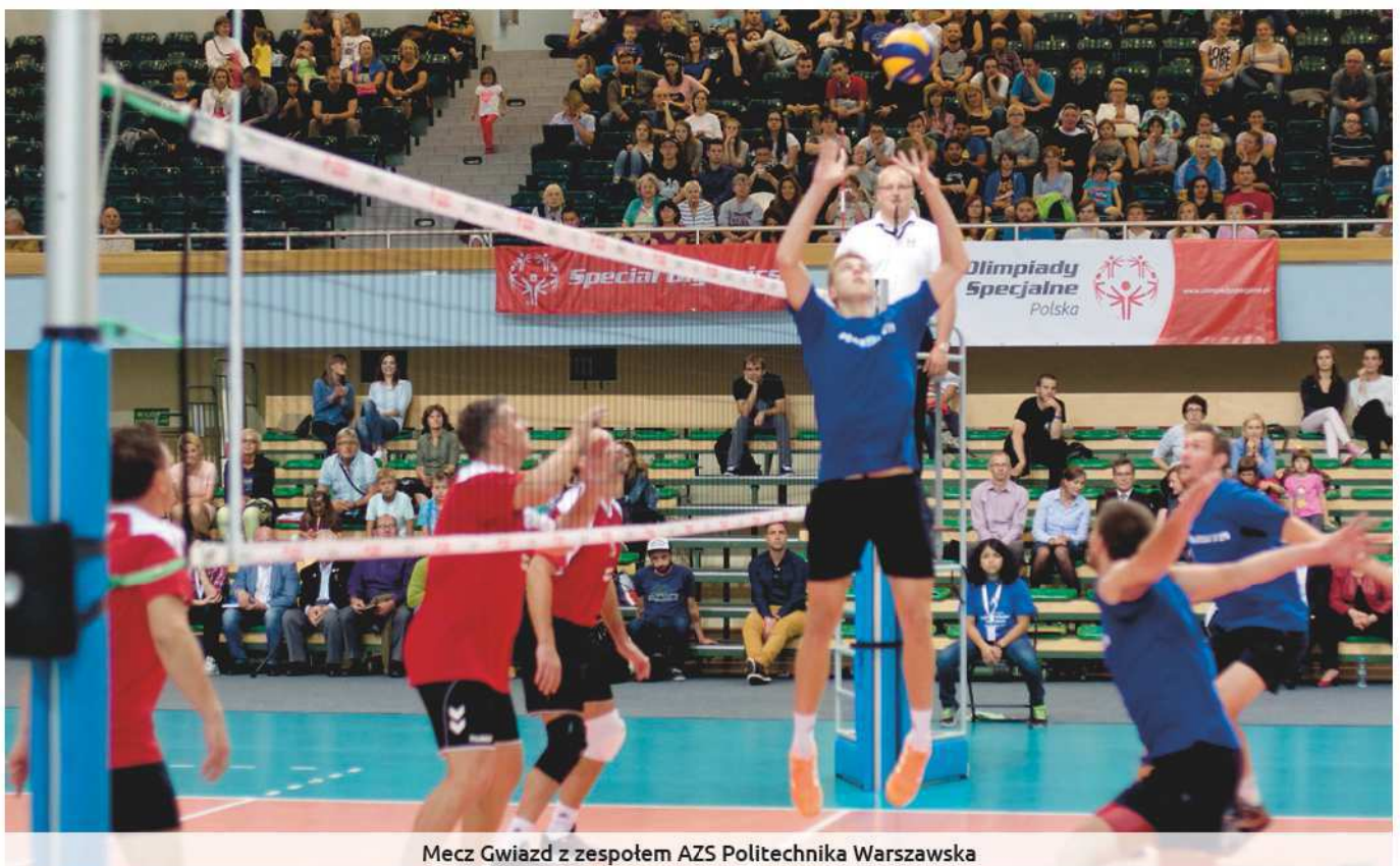
Mecz Gwiazd z zespołem AZS Politechnika Warszawska

I w końcu w lipcu 2013 roku drużyna zunifikowana z OR Dolnośląskie pod prze-