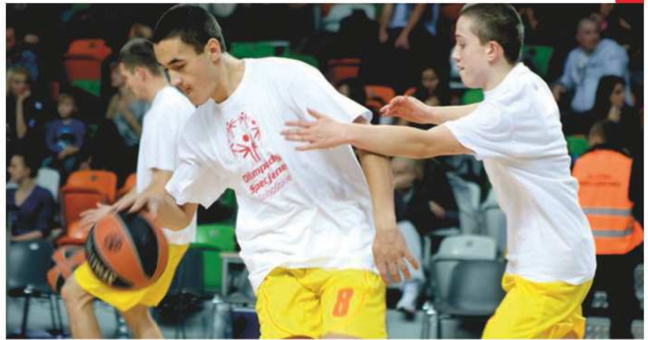
Koszykarze Olimpiad Specjalnych Polska podczas meczu pokazowego

Ponadto, przed każdym z 14 meczów 9. kolejki Tauron Basket Ligi i Tauron Basket Ligi Kobiet, od 28 listopada do 2 grudnia, zawodnicy Olimpiad Specjalnych wychodzili na parkiety razem z koszykarkami i koszykarzami i byli przedstawieni publiczności. Koszykarze zaprezentowali się widowni w koszulkach Olimpiad Specjalnych i w ten sposób uhonorowali zawodników z nie-