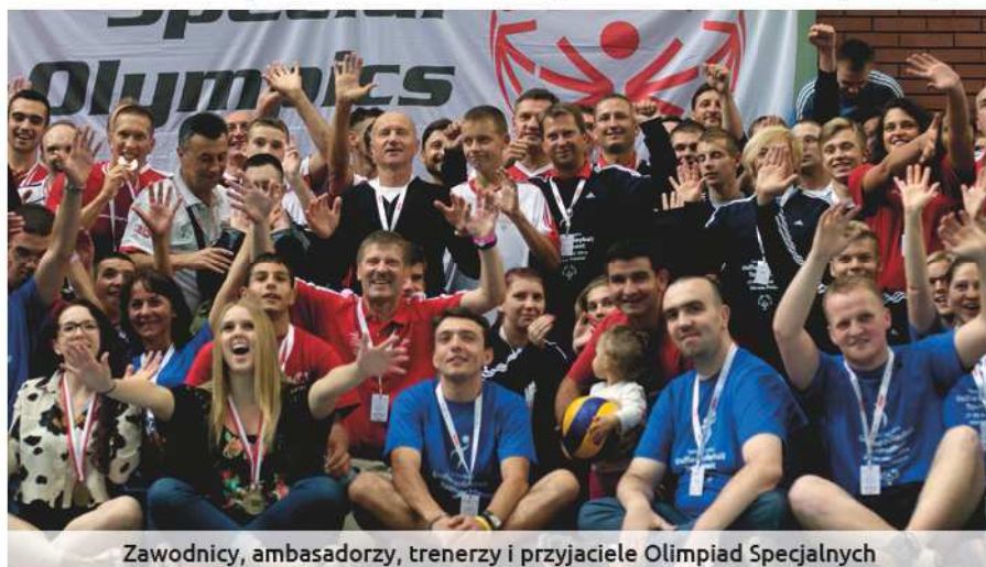
Zawodnicy, ambasadorzy, trenerzy i przyjaciele Olimpiad Specjalnych

Co dalej? W roku 2016 planujemy organizację turnieju piłki siatkowej zunifikowanej w Serbii. Wiemy też, że Polska otrzymała organizację mistrzostw Europy mężczyzn w 2017 roku. Czy i tym razem będziemy mogli gościć zawodników Olimpiad Specjalnych w naszym kraju? Wierzę, że jest to możliwe i że taki turniej zachęci jeszcze większą liczbę naszych trenerów do zainteresowania się piłką siatkową w Olimpiadach Specjalnych. Wierzę w Was – zawodnicy, trenerzy i Przyjaciele Olimpiad Specjalnych.