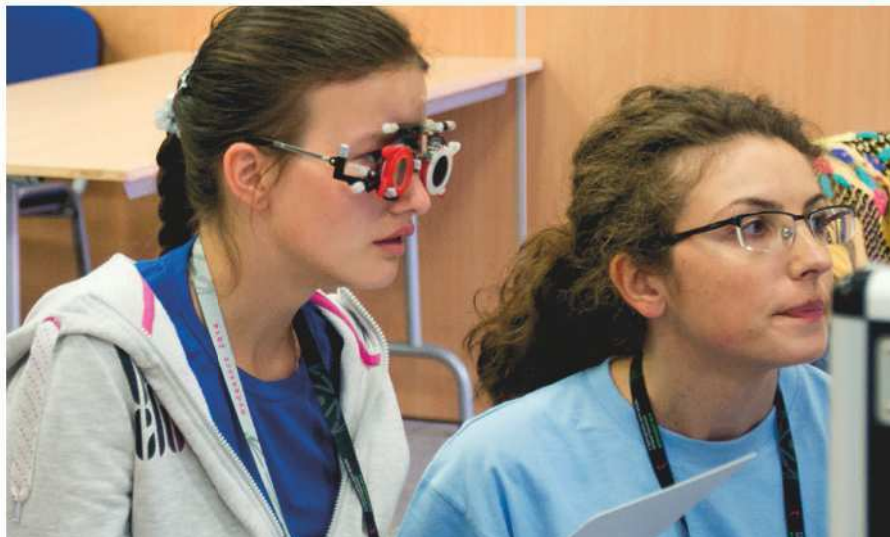
Badanie w ramach Programu Zdrowe Oczy