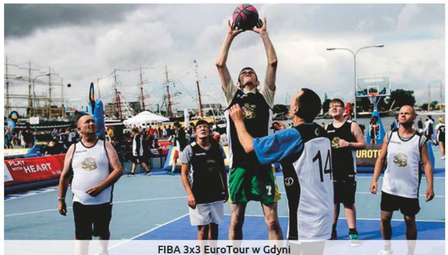
FIBA 3x3 EuroTour w Gdyni