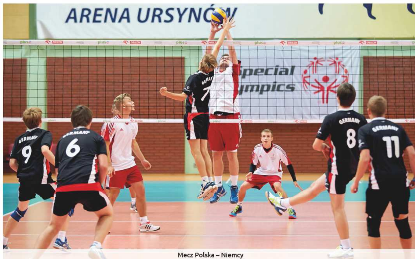
Mecz Polska – Niemcy

Siatkarze Olimpiad Specjalnych Polska pokonali USA i zajęli trzecie miejsce. W finale Serbia po zaciętym meczu wygrała z Niemcami. W turnieju wzięły udział cztery drużyny zunifikowane – złożone z zawodników z niepełnosprawnością intelektualną i pełnosprawnych partnerów.