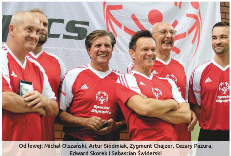
Od lewej: Michał Olszański, Artur Siódmiak, Zygmunt Chajzer, Cezary Pazura, Edward Skorek i Sebastian Świderski