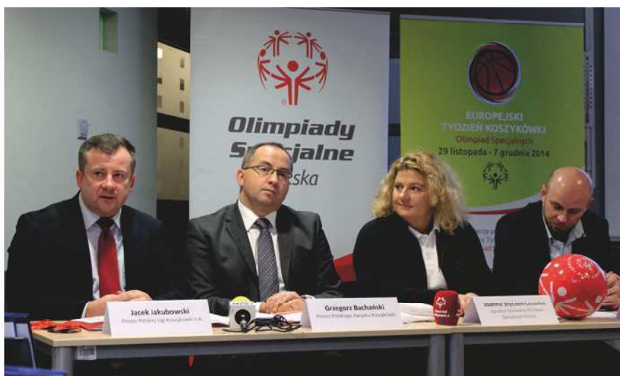
Konferencja prasowa XI Europejskiego Tygodnia Koszykówki Olimpiad Specjalnych

– Bardzo się cieszę, że kolejny raz profesjonalni koszykarze wspierają ideę rywalizacji sportowej wśród osób z niepełnosprawnością intelektualną. To daje możliwość udziału zawodników Olimpiad Specjalnych w wydarzeniach sportowych na najwyższym poziomie, szerzy ideę akceptacji oraz tolerancji i pozwala walczyć ze stereotypami. Pozwólmy osobom z niepełnosprawnością intelektu-