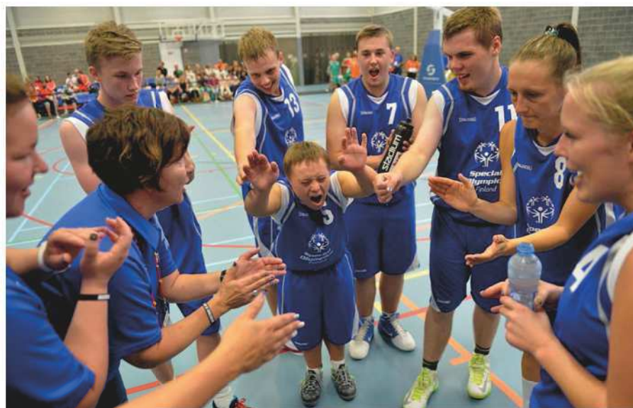
Reprezentacja koszykówki Olimpiad Specjalnych Finlandia

Kolejny dzień za nami. Niektóre dyscypliny zakończyły rywalizację (badminton i koszykówka unifikowana), niektórzy, jak koszykarze, odkrywali uroki Antwerpii i uczestniczyli w ceremonii dekoracji.