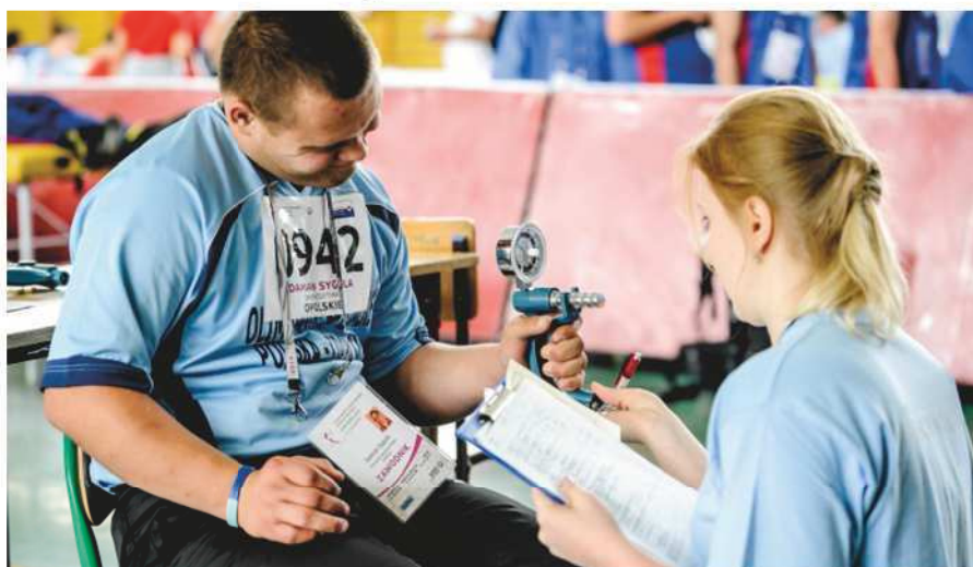
Badanie w ramach Programu FUNFitness

Poprzez wspieranie fundacji non-profit Hear The World wiodący producent