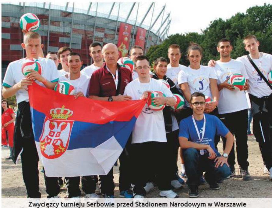
Zwycięzcy turnieju Serbowie przed Stadionem Narodowym w Warszawie