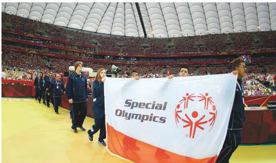
Zawodnicy Olimpiad Specjalnych przed meczem Polska - Serbia na siatkarskich MŚ