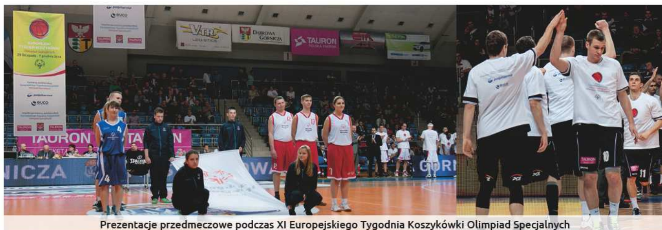
Prezentacje przedmeczowe podczas XI Europejskiego Tygodnia Koszykówki Olimpiad Specjalnych