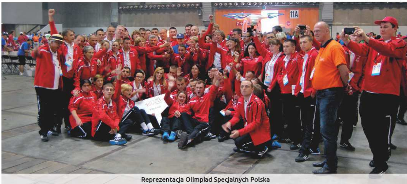
Reprezentacja Olimpiad Specjalnych Polska

Wspaniała ceremonia otwarcia przywitała zawodników Olimpiad Specjalnych, a igrzyska otworzyła królowa Belgów Matylda. Największa sportowa impreza roku w Europie odbyła się w dniach 9-20 września w Antwerpii. Wzięło w niej udział prawie 2000 zawodników z niepełnosprawnością intelektualną z 58 krajów, w tym z Polski.