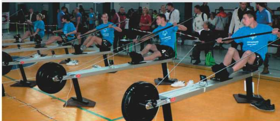
Zawodnicy Olimpiad Specjalnych Polska podczas ćwiczeń na ergometrach