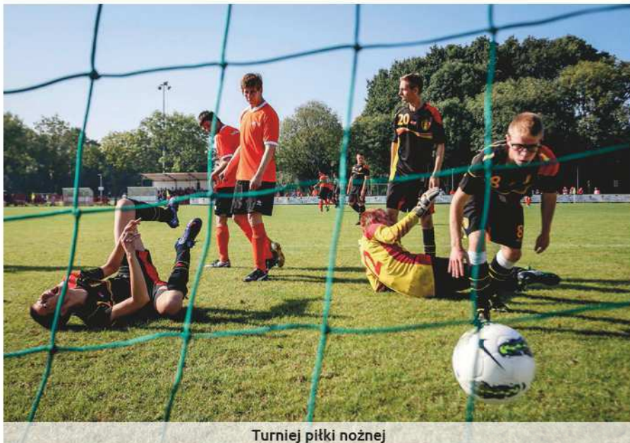
Turniej piłki nożnej

z ogniem olimpijskim. Po uroczystości zawodnicy wzięli udział w festynie sportowym i poprawili swoją formę przed igrzyskami. Festyn został zorganizowany przez władze miasta Liege, a jego wykonawcami byli instruktorzy prowadzący zajęcia dla osób z niepełnosprawnością intelektualną.